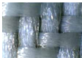
Immagine al microscopio del tessuto

Ne consegue che l'articolo Batavia trattiene particelle di dimensioni superiori ai 15 micron